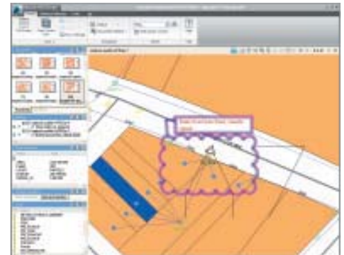
Le note di revisione realizzate con Design Review vengono registrate nella Gestione gruppo di revisioni di Revit, Inventor, Civil 3D o AutoCAD per una navigazione semplificata e revisioni rapide.