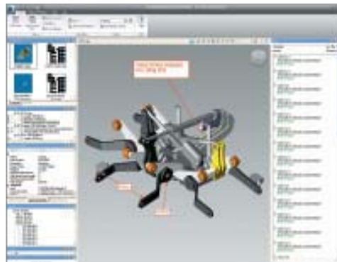
Le note di revisione realizzate sui modelli rimangono sempre disponibili per la consultazione.